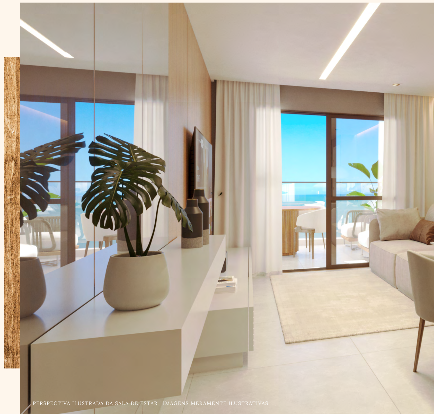
PERSPECTIVA ILUSTRADA DA SALA DE ESTAR | IMAGENS MERAMENTE ILUSTRATIVAS

Cada planta do Castellamare foi pensada para traduzir conforto, amplitude e fluidez . Com metragens generosas e layouts inteligentes, as unidades se adaptam ao estilo de vida de quem valoriza praticidade, bem-estar e, claro, uma vista deslumbrante para o mar . Faça sua escolha e venha viver com mais tranquilidade e elegância, em um dos endereços mais exclusivos do litoral capixaba.