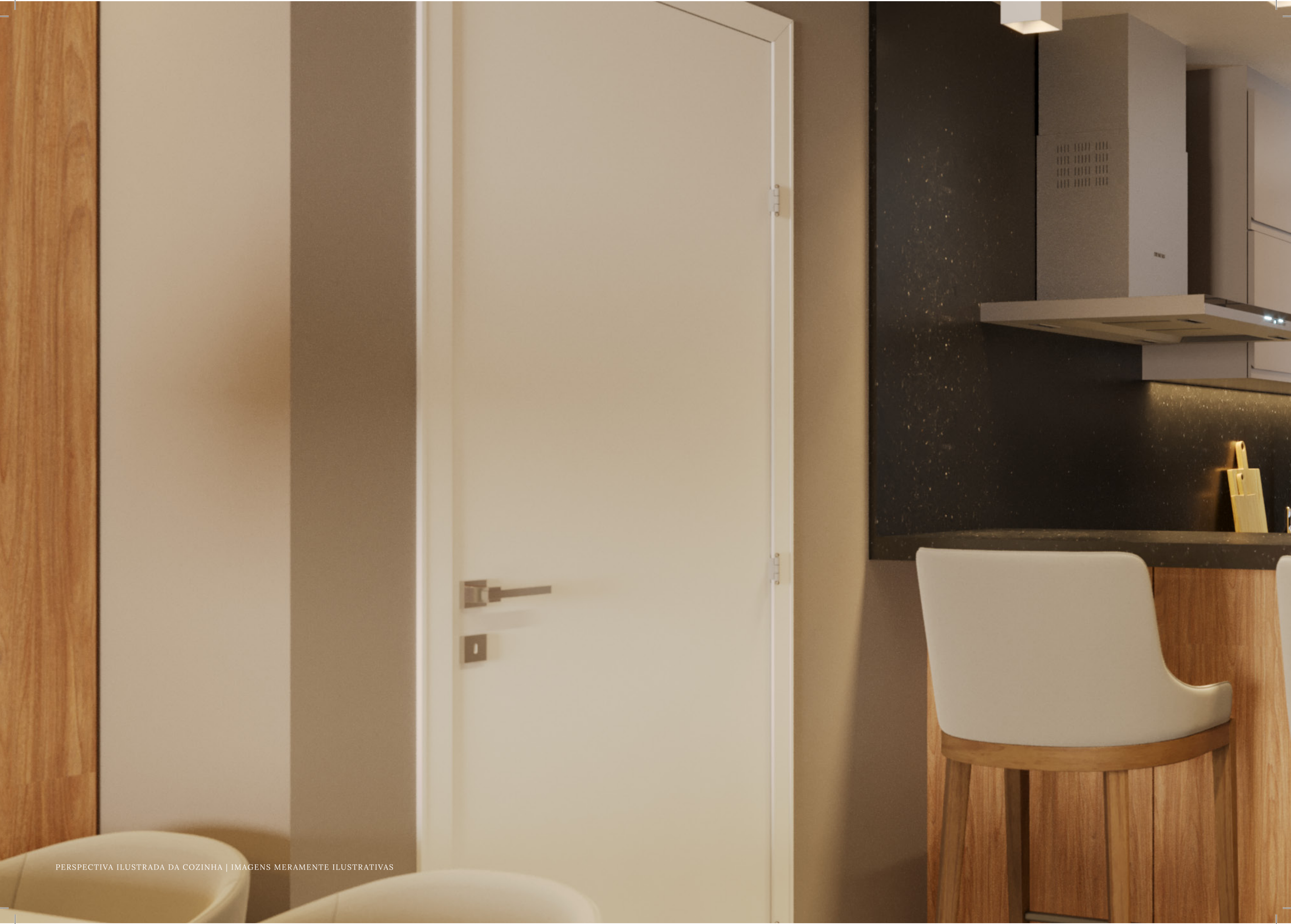
PERSPECTIVA ILUSTRADA DA COZINHA | IMAGENS MERAMENTE ILUSTRATIVAS