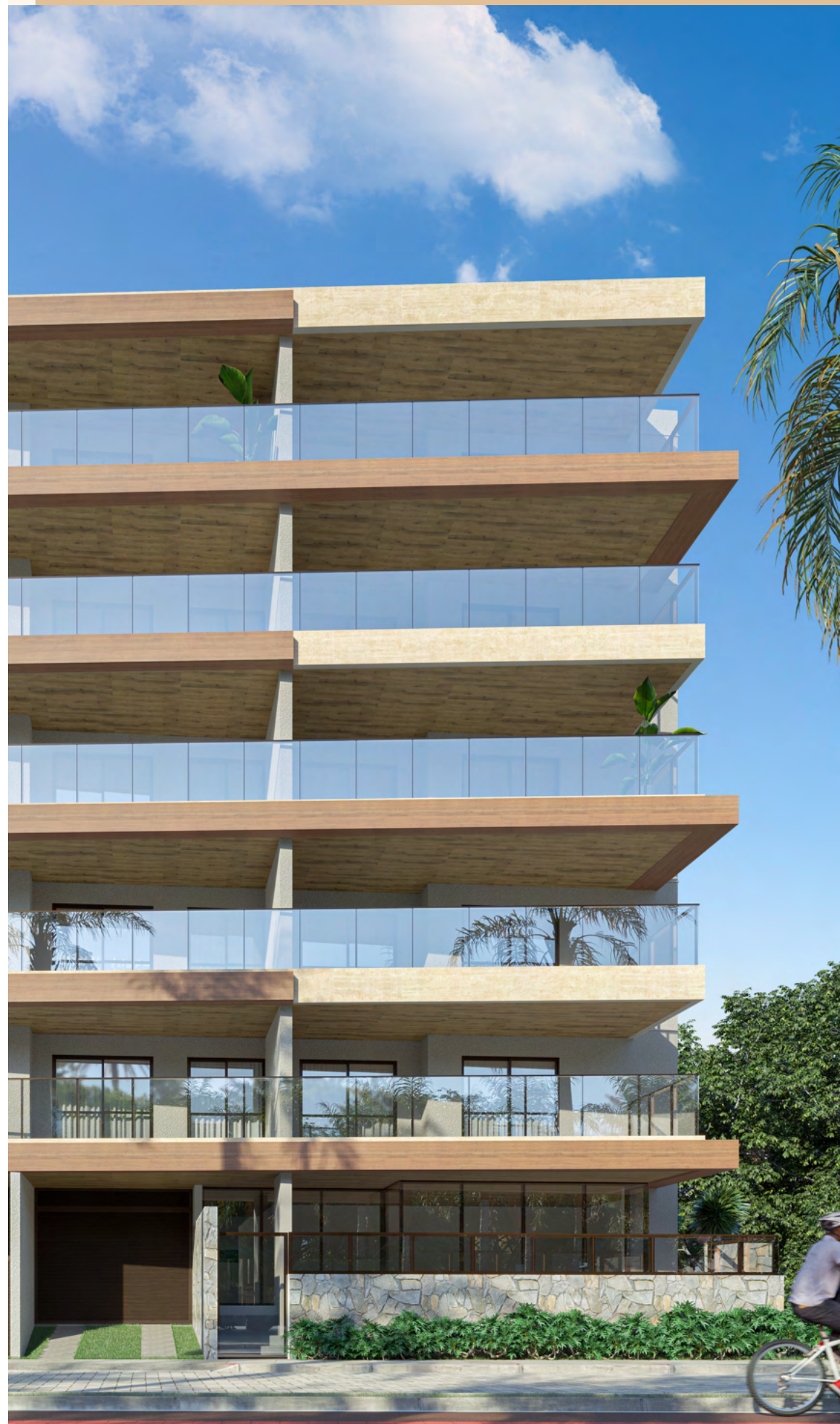
PERSPECTIVA ILUSTRADA DA FACHADA | IMAGENS MERAMENTE ILUSTRATIVAS