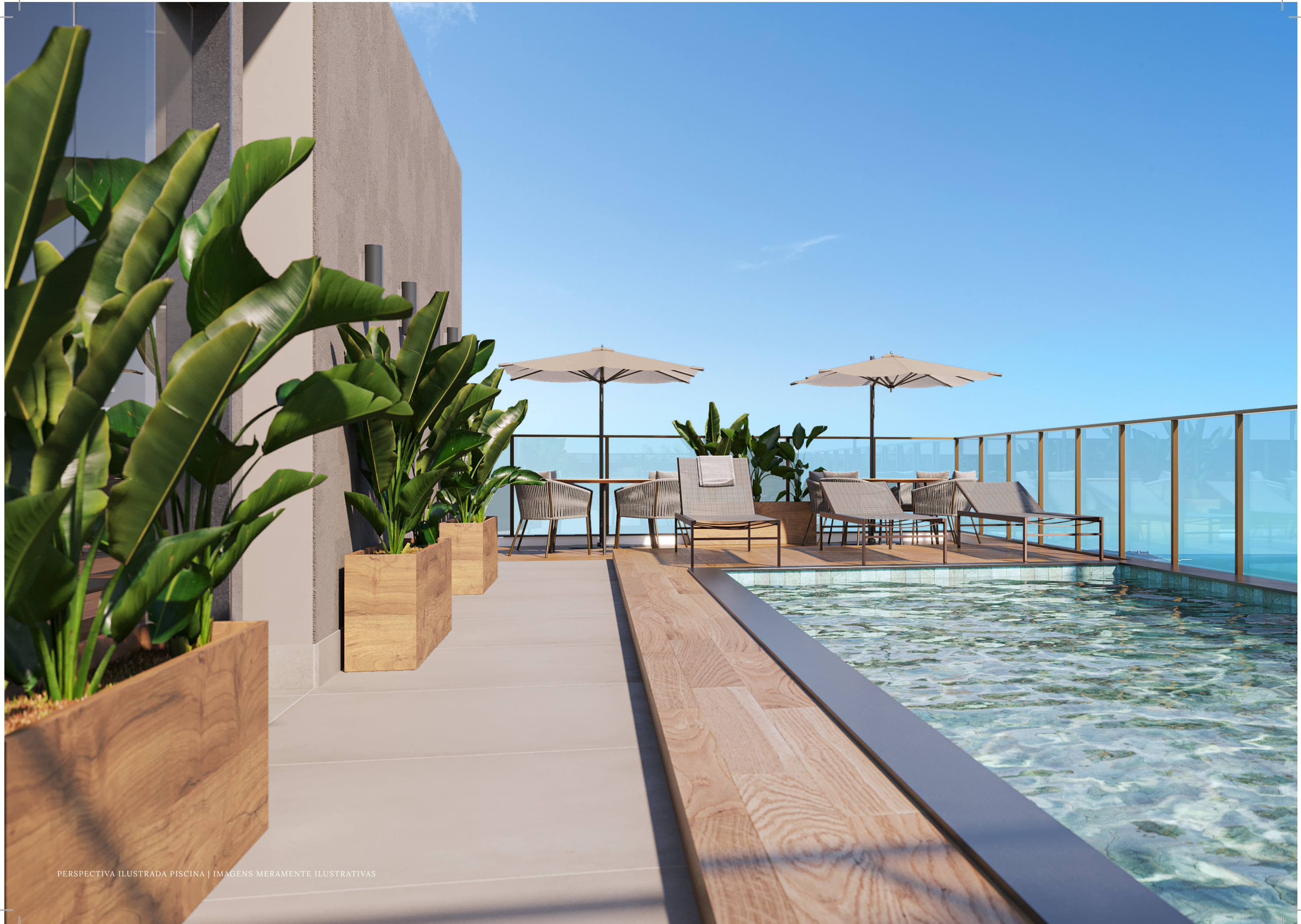
PERSPECTIVA ILUSTRADA PISCINA | IMAGENS MERAMENTE ILUSTRATIVAS