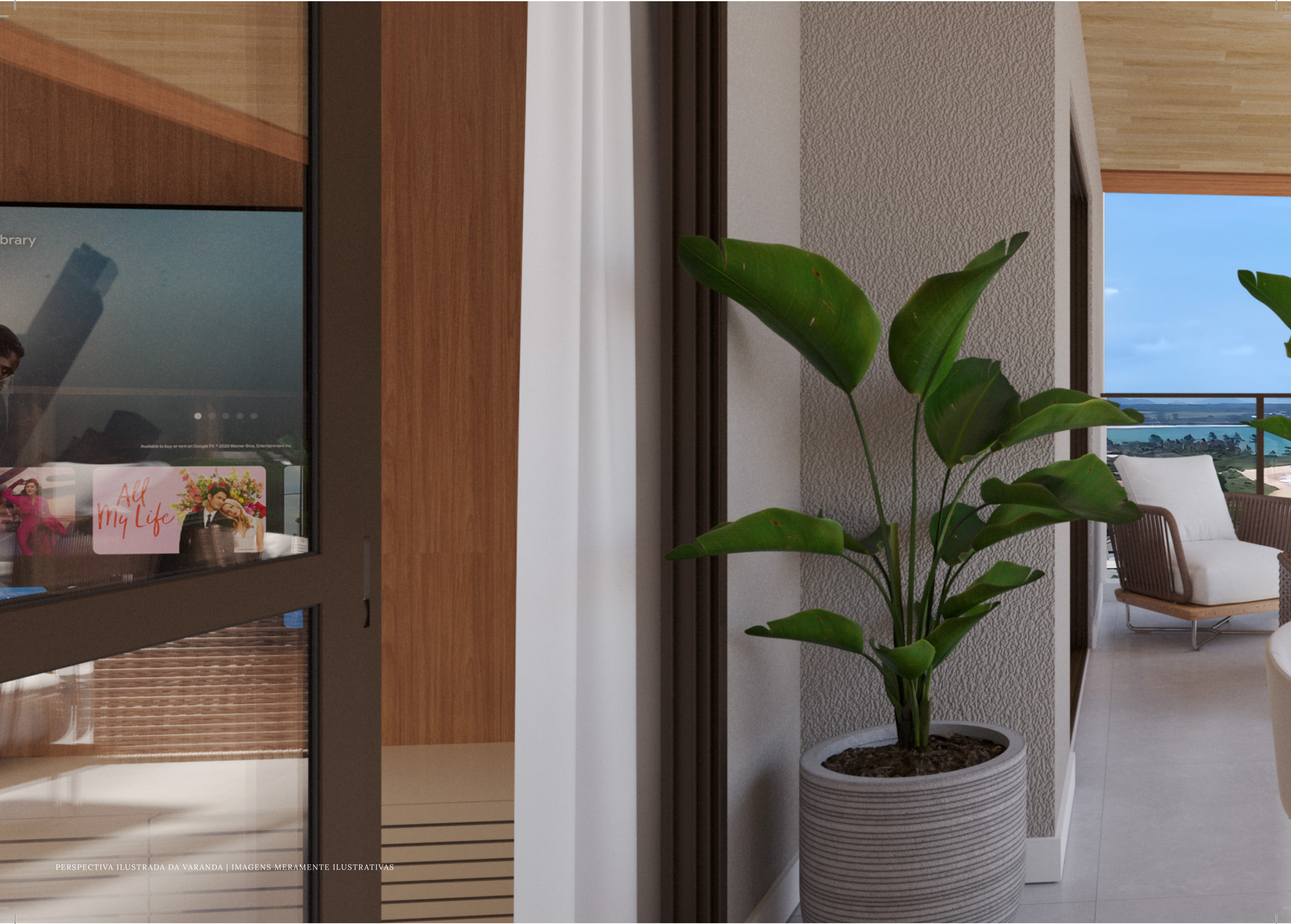
PERSPECTIVA ILUSTRADA DA VARANDA | IMAGENS MERAMENTE ILUSTRATIVAS