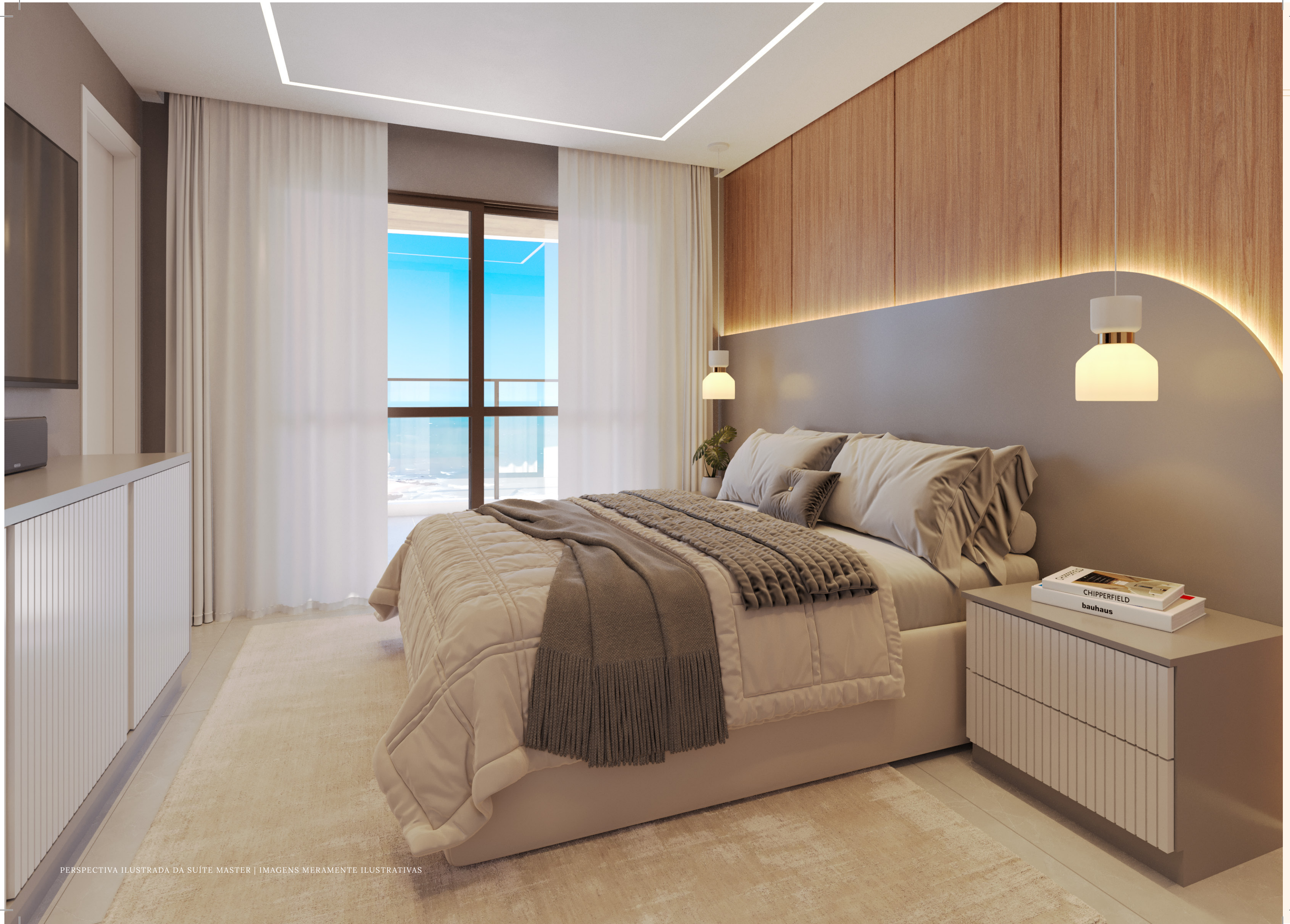
PERSPECTIVA ILUSTRADA DA SUÍTE MASTER | IMAGENS MERAMENTE ILUSTRATIVAS